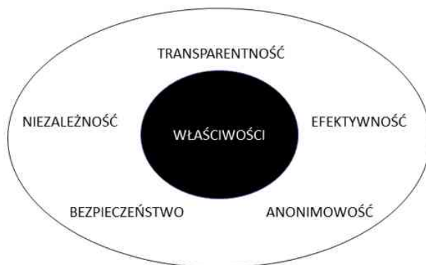
Rys.3. Właściwości blockchain

nowych bloków. Oznacza to, iż jeśli chcemy, możemy wyśledzić Bitcoin, gdziekolwiek się pojawi.